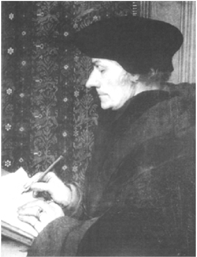
ארזמוס: מאבות תנועת ההומניזם באירופה

לימודי יהדות כתרבות שונים הן מלימודי יהדות כדת והן מלימודי ההיסטוריה המדינית, החברתית והכלכלית של העם היהודי. לימודי יהדות כתרבות יתבססו על מבחרים ממכלולי היצירה היהודית על רקע ההיסטוריה החברתית והמדינית והכלכלית.